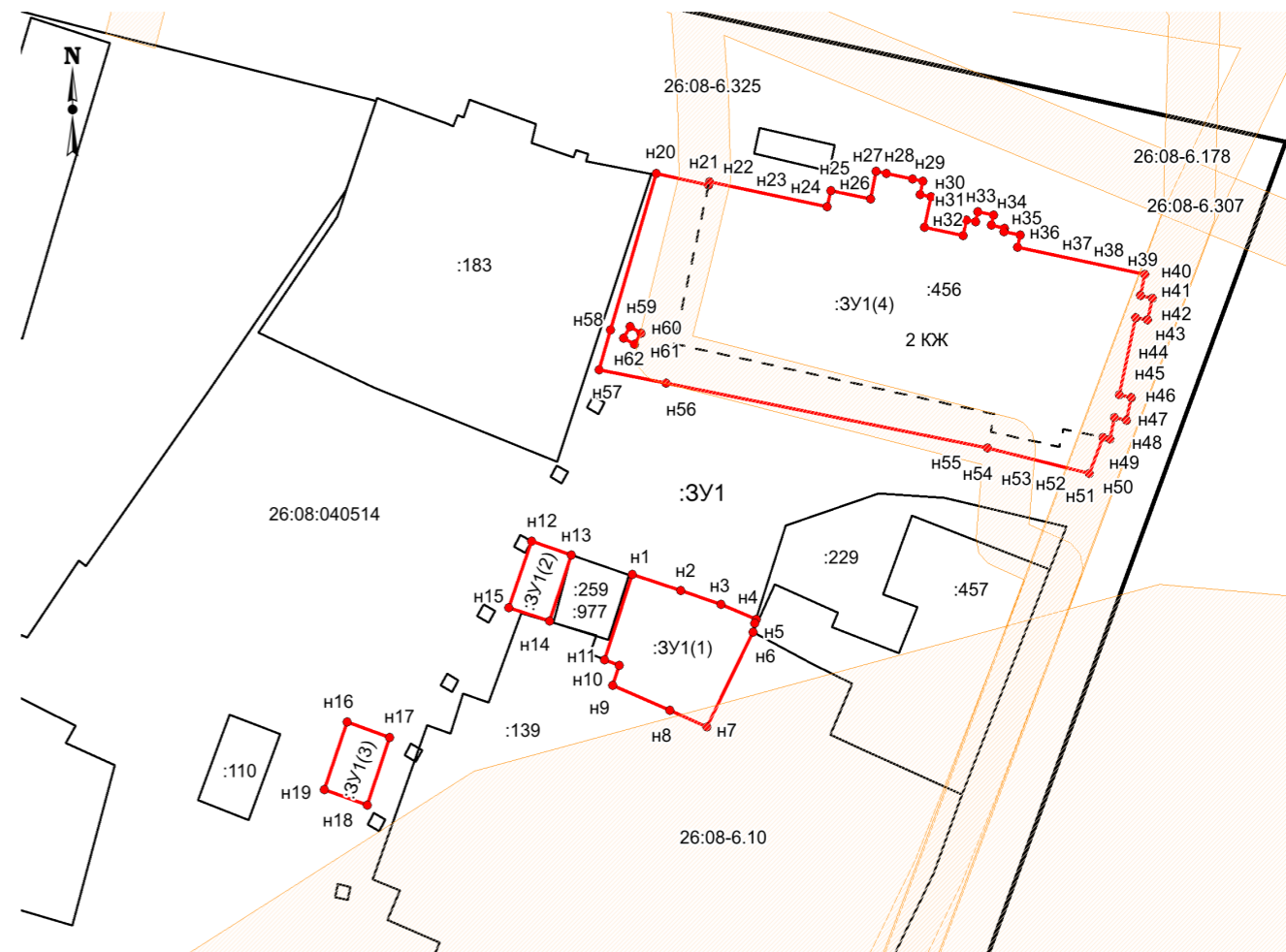
Масштаб 1: 500 МСК-26 от СК-95, зона 1